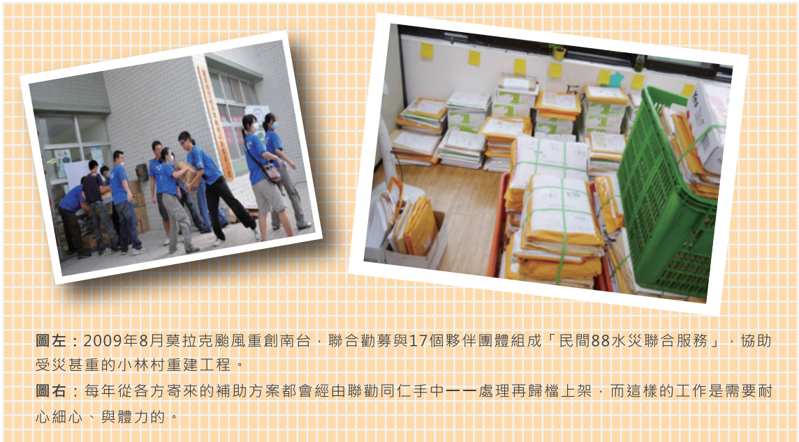
圖左：2009年8月莫拉克颱風重創南台，聯合勸募與17個夥伴團體組成「民間88水災聯合服務」，協助受災甚重的小林村重建工程。