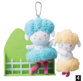
圖 4：花旗聯合勸募活動以「愛心見證禮」，感謝捐款人獻愛心。圖為「Love 心動羊組」，功能包括綁書帶、環保袋及吊飾。

圖 3：全台首創戶外汽車電影院號召大眾獻出愛心，並吸引百位復古經典車主與民眾共襄盛舉。蒞臨嘉賓（左起）：名主持人寇乃馨、職棒選手劉芙豪、聯合勸募陳永清理事長、車輛文化推廣協會曾彥豪理事長、經典 90 何華會長。中間為本屆活動吉祥物「心動羊」人偶。