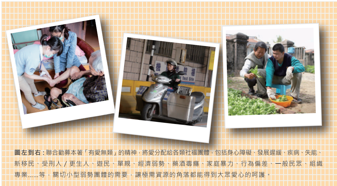
圖左到右：聯合勸募本著「有愛無類」的精神，將愛分配給各類社福團體，包括身心障礙、發展遲緩、疾病、失能、新移民、受刑人／更生人、遊民、單親、經濟弱勢、藥酒毒癮、家庭暴力、行為偏差、一般民眾、組織專業……等，關切小型弱勢團體的需要，讓極需資源的角落都能得到大眾愛心的呵護。

聯合勸募在國外發展已有百年歷史，在youtube上打入關鍵字united way，就會紛紛跳出各地的聯合勸募所拍攝的影片，這些影片裡，呈現著有來自各種弱勢團體，包括兒童、老人、婦女和重大意外災害等族群的感謝畫面，聯合勸募的核心價值其實就是「helping people」（幫助他人）並且透過多年的監督和制度建立，成為全球最被信賴的慈善組織，許多在台外商企業制定企業公益和形象策略時，首先就指定聯合勸募為合作夥伴，因為這是讓人安心的品牌，但是讓我們回到原點想想，台灣公益團體這麼多，為什麼我們需要聯合勸募？