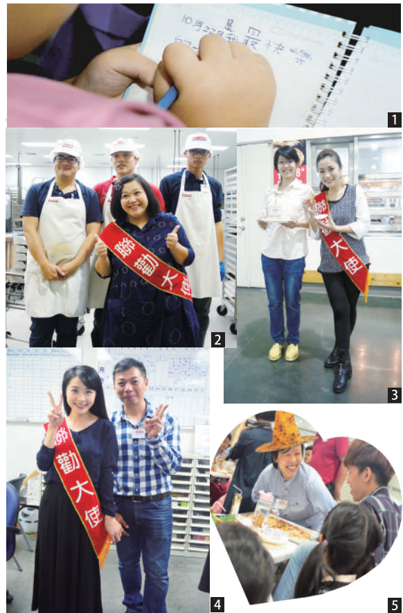
圖1：參與活動的弱勢孩童在筆記本上寫下參觀好市多賣場的快樂心情。

好市多在公益的用心也延伸至支持弱勢孩童們的學習上。2005年起，好市多每年透過聯合勸募捐贈愛心書包，並在開學前將書包送到全台每一個需要的角落；截至2014年12月，已送出近萬個愛心書包，為弱勢兒童的學習提供最溫暖的後盾。好市多企業與員工同心齊力做好事，讓原本溫馨的愛心活動充滿創意與活力，也為公益關懷開創了全新的思維與更多可能性！